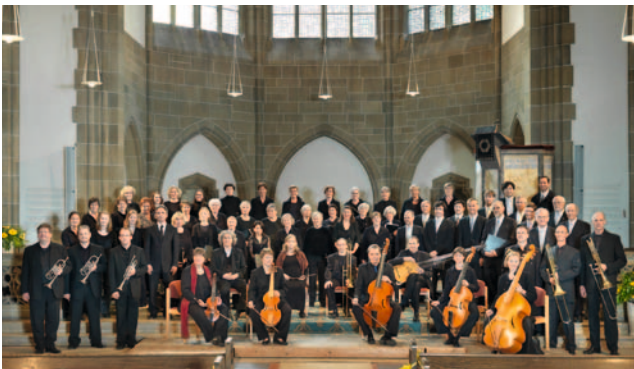
Kantorei der Christuskirche Detmold

Karten sind ab dem 15. Februar 2014 im HAUS DER MUSIK, Detmold, erhältlich. Krumme Straße 26, Tel. 0800 00 68745